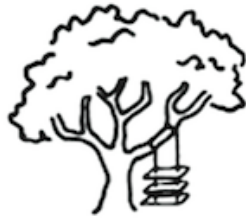
As marketing requested it.