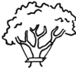
What was manufactured.