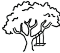
As sales ordered it.