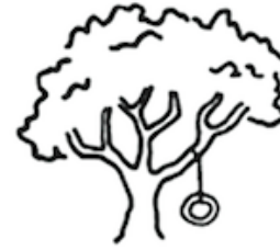
What the customer wanted.

Gelukkig voor mij, want ik vond de opdracht bijzonder interessant, werd ik gecoacht door mijn begeleider. En volgens mij gold dit ook voor de opdrachtgever. Ook zij werd gecoacht om met mij om te gaan. Wat ik uiteindelijk geleerd heb is dat ik het best functioneer in mijn eigen omgeving, en dat ik communicatie vreselijk ingewikkeld vind. En dat is onveranderbaar. Hier moet ik het mee doen.