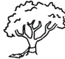
As engineering designed it.