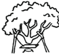
What was installed.